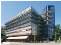
Standort Achern Josef-Wurzler-Straße 7 77855 Achern