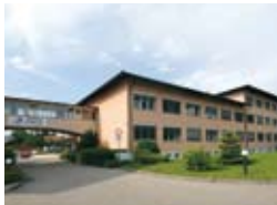
Standort Oberkirch Franz-Schubert-Straße 15 77704 Oberkirch